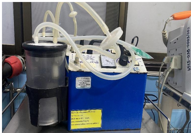
เครื่องดูดเสมหะ

4) เครื่องดูดเสมหะ ออกซิเจนและอุปกรณ์ช่วยหายใจ