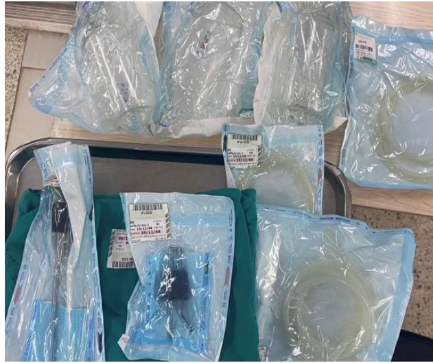
ชุดล้างท้อง

7) ชุดรักษาฉุกเฉิน เช่น ชุดเจาะปอด ชุดเจาะคอ ชุดให้น้ำเกลือโดยทางผ่าเส้นเลือดและ คอมไฟ ส่องเฉพาะทาง