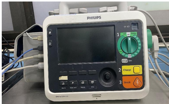
เครื่องกระตุ้นหัวใจ

4) เครื่องดูดเสมหะ ออกซิเจนและอุปกรณ์ช่วยหายใจ